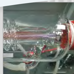
long life DC-Laserquelle